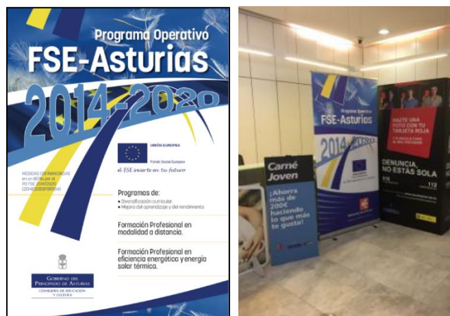
Ilustración 2. Soportes publicitarios distribuidos por el Organismo Intermedio

Asimismo, durante este periodo el Organismo Intermedio ha elaborado trípticos y un enara con la publicidad del Programa Operativo FSE Asturias 2014-2020.