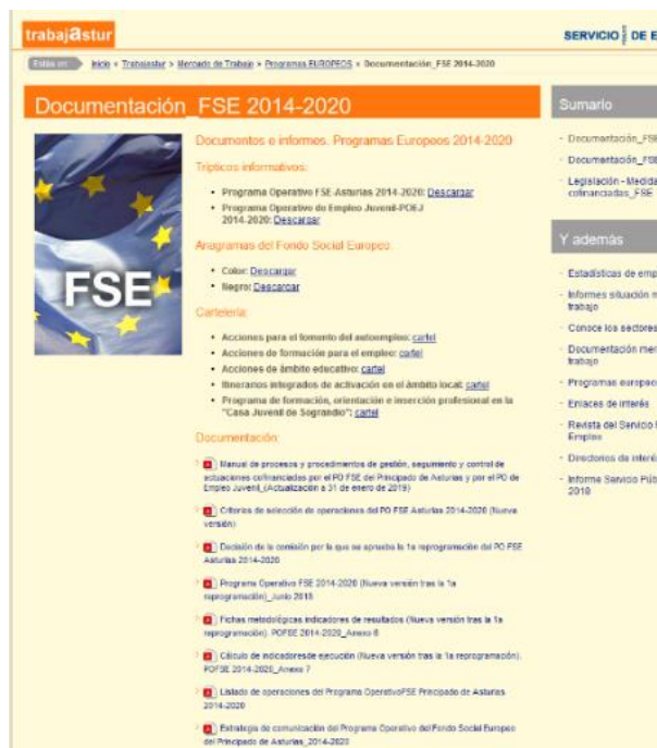
Ilustración 1. Sección del PO FSE en la página web del Organismo Intermedio

En esta página web se incluyen la totalidad de las convocatorias del PO FSE que han sido publicadas en el Boletín del Principado de Asturias (BOPA). Además, se incluye el acceso a las plantillas de cartelería, los trípticos informativos y los anagramas del Fondo Social Europeo ( https://www.asturias.es/portal/site/trabajastur ).