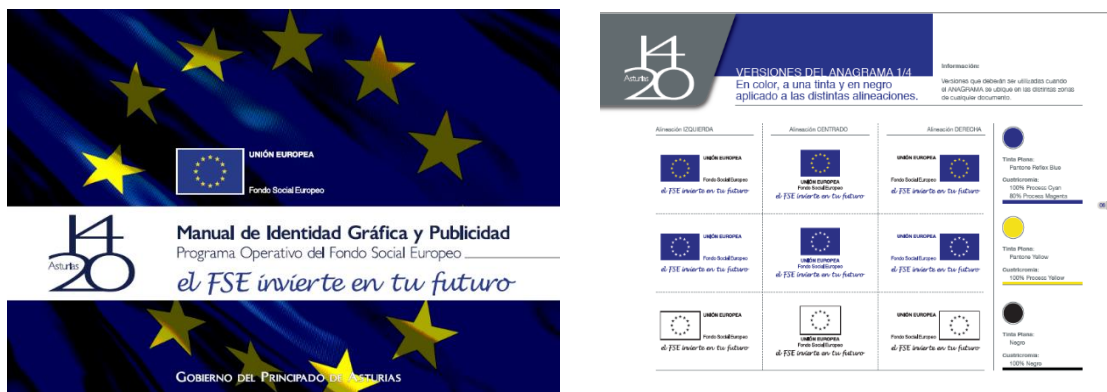
Ilustración 4. Manual de Identidad Gráfica y Publicidad proporcionado por el Organismo Intermedio

Esta entidad es la responsable de editar y distribuir los carteles A3 a los Órganos Gestores/Beneficiarios conforme a la normativa comunitaria. De esta manera se garantiza la correcta aplicación de la normativa y de la identidad gráfica.